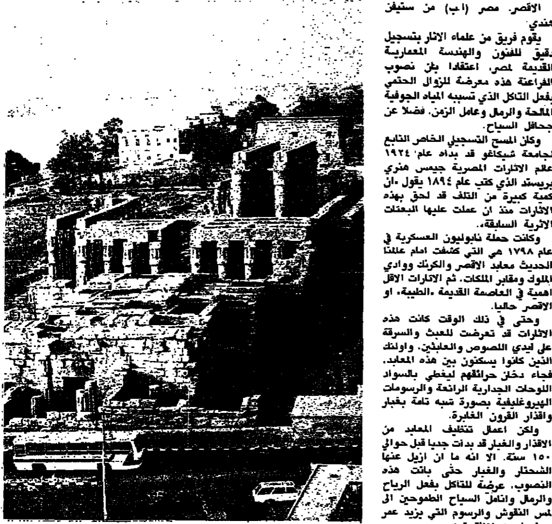
مدينة الاقصر على الضفة الشرقية لنهر النيل - والصورة من منظر من سفح احد الفئق